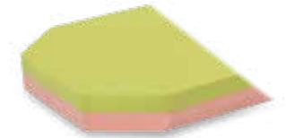
sprint 100 Advanced Matratzenhöhe: 13 cm, viskoelastischer Schaum und Termic™-Technologie