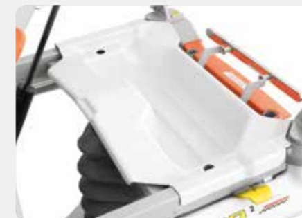
Integrierte Kunststoffbox Zusätzlicher Stauraum für persönliche Gegenstände