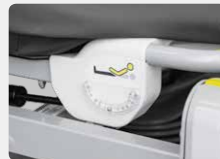
Winkelanzeige Anzeige des Neigungswinkels für Rückenlehne und Liegefläche