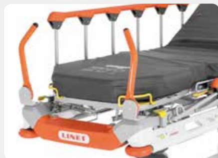
Schiebegriffe Einfache Handhabung durch Einhand-Bedienung