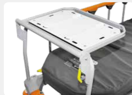
Monitortablett 3-in-1-Multifunktionszubehör als Monitor- tablett, Fußstütze und Schreibunterlage