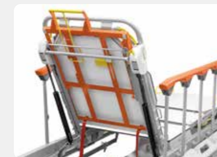
Röntgenfähige Rückenlehne Ermöglicht die Durchführung von Röntgenaufnahmen oder den Einsatz eines C-Bogens