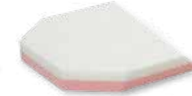
sprint 100 Comfort Matratzenhöhe: 10 cm, viskoelastischer Schaum