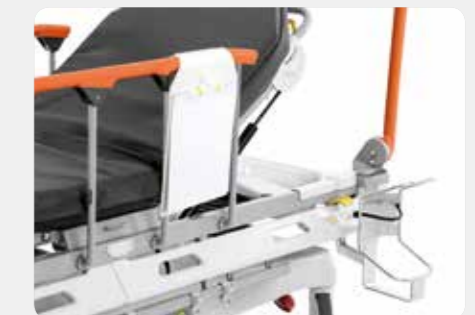
Sauerstoffflaschenhalterung Vertikale und rotierbare Halterung für die Sauerstoffflasche