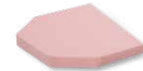
sprint 100 Standard Matratzenhöhe: 8 cm

sind an ihren Nahtverbindungen für eine verbesserte Infektionskontrolle verschweißt und vernäht.